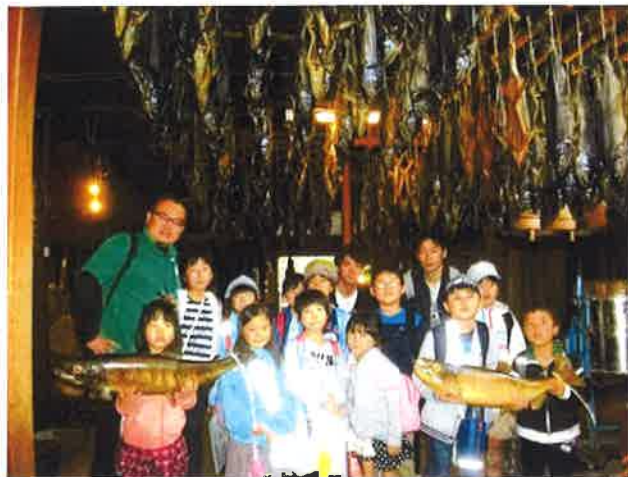
天井いっぱいの鮭にびっくり！